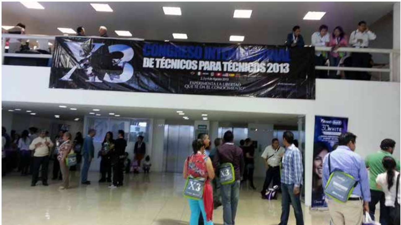
Disfrute mucho estar apoyando en el Área Comercial