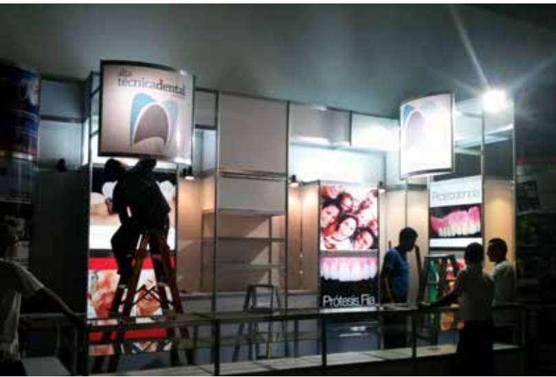
Montaje del STAND

Alma la imagen del Stand, el cual espero les haya gustado y el día del montaje me quedé hasta terminarlo para que estuviera listo para que el equipo de ATD pudiera montar los materiales de venta, ir fue bastante difícil porque tenía muchos proyectos pendientes en la oficina pero aún así aparte tiempo para estar ahí. Ver cómo colocaban cada pieza del stand, cada imagen que hicimos, las luces y la decoración fue algo sensacional para mí.