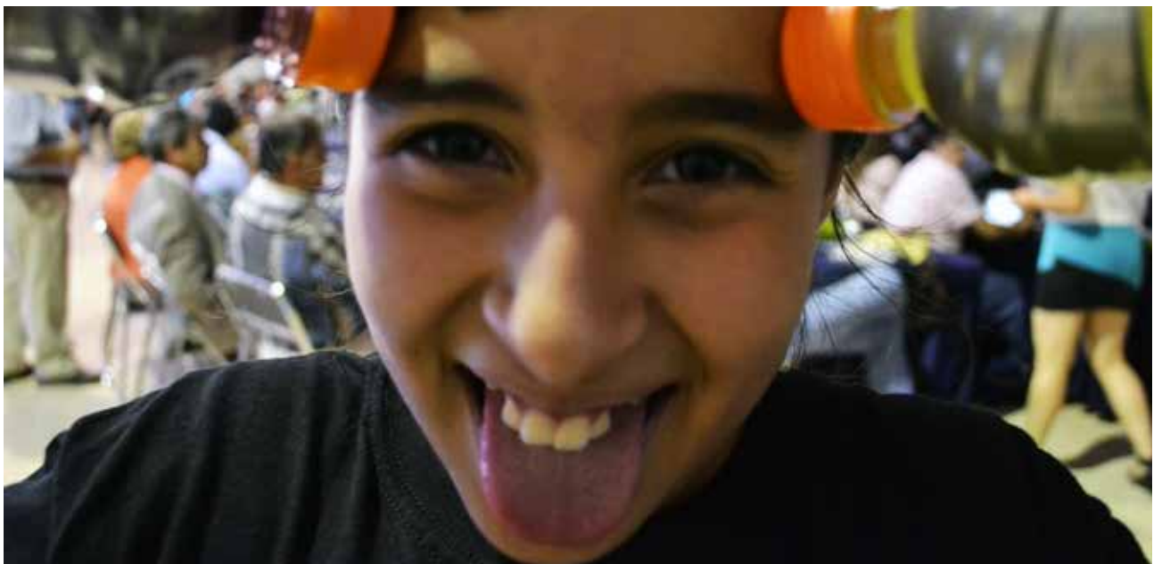
Mi hija me apoyó en el evento