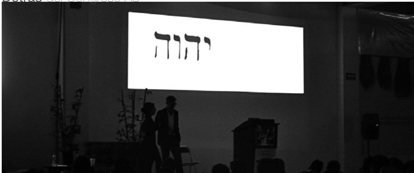
La bendición de Dios estuvo presente