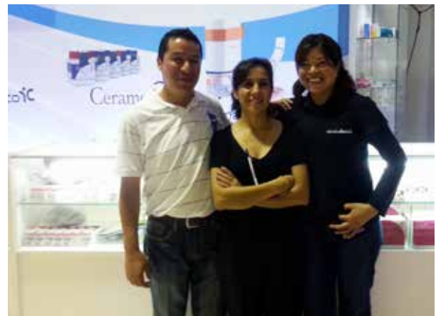
Mi equipo siempre me apoyó