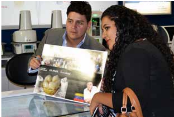
Uno de los poster que hice

Nos vemos en el próximo evento donde intentaremos llenar de color cada paso que des.