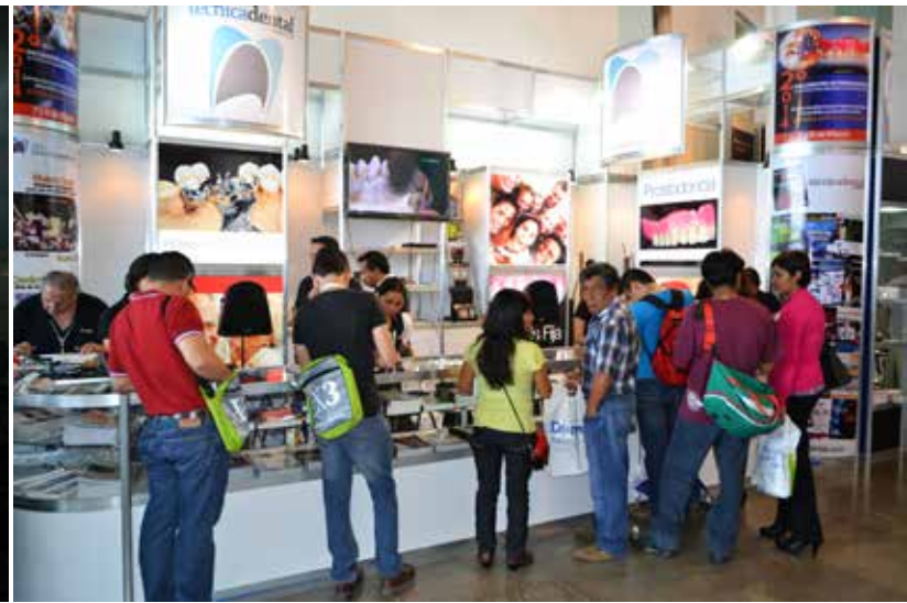
El Stand durante el Evento

Alma la imagen del Stand, el cual espero les haya gustado y el día del montaje me quedé hasta terminarlo para que estuviera listo para que el equipo de ATD pudiera montar los materiales de venta, ir fue bastante difícil porque tenía muchos proyectos pendientes en la oficina pero aún así aparte tiempo para estar ahí. Ver cómo colocaban cada pieza del stand, cada imagen que hicimos, las luces y la decoración fue algo sensacional para mí.