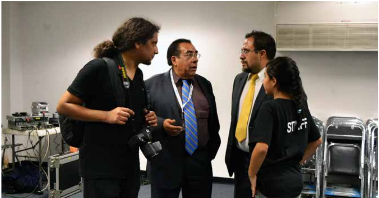
Refinando últimos detalles