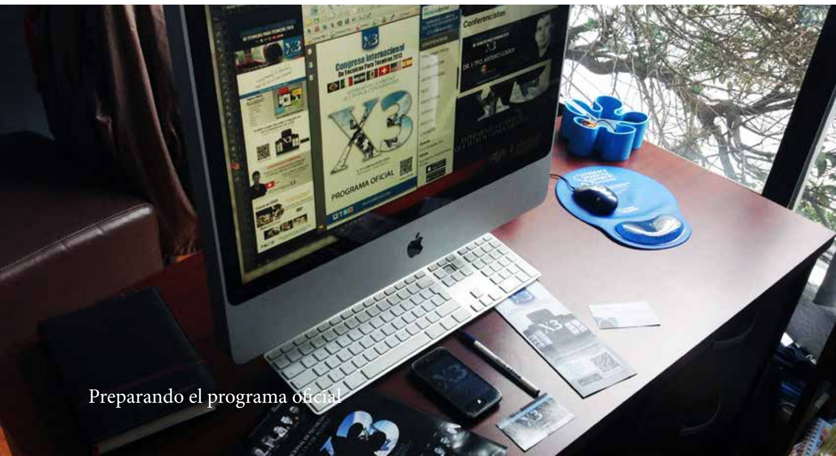
Preparando el programa oficial