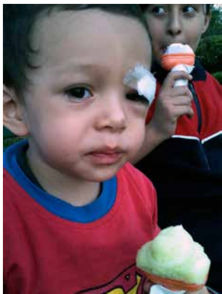
No siempre todo sale bien...