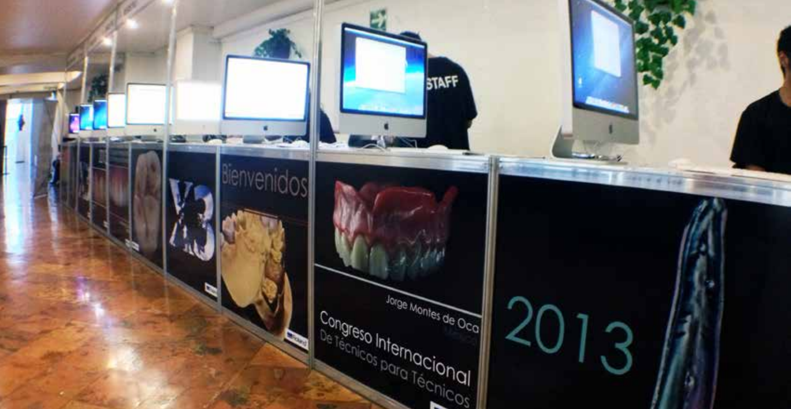
El registro listo para recibir a los invitados

Algo que destaco de esta función es que cuando las personas llegan todas quieren entrar muy rápido, no quieren perder ninguna conferencia, entonces son muy impacientes y hay quien es hasta grosero con el personal, pero no nos fijamos en eso, lo que nos llevamos de ellos es la sonrisa de satisfacción que nos regalan cuando imprimimos su nombre en su constancia. Saber que colaboré para que estas personas estuvieran capacitadas para su trabajo es la mejor recompensa.