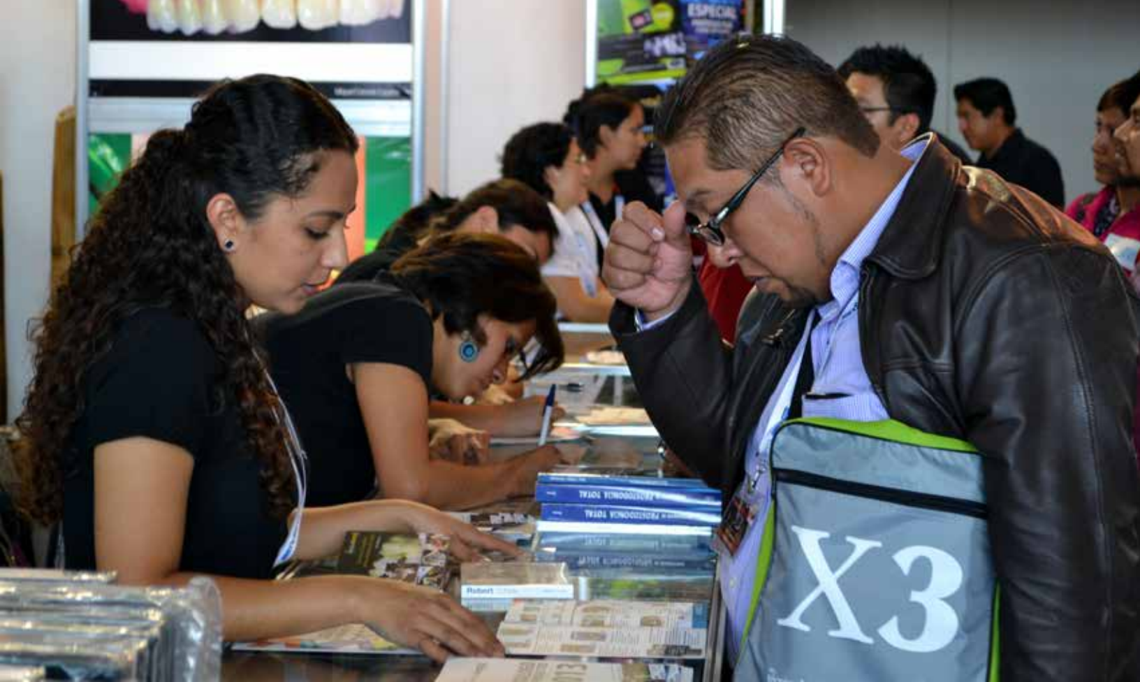
Atender a los clientes es genial

El plan subir una caja por persona del piso 6 al piso 8, para que les miento ¡no pudimos! ¡Son bastante pesadas! más de 80 revistas por caja aproximadamente! ¡Imagínate! Buscamos alguna otra alternativa y la encontramos: nos prestaron un carrito de esos del súper, así que subimos todo al carrito y entonces fue un poco mas fácil para nosotras. Al final de la noche el STAND estaba listo para empezar el día siguiente.