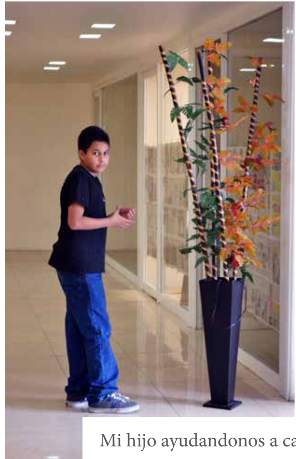
Mi hijo ayudandonos a cargar